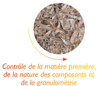
Contrôle de la matière première, de la nature des composants et de la granulométrie

En savoir plus : www.laboratoire-ceric.com