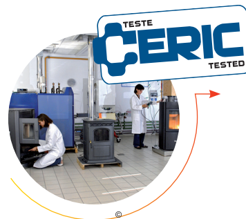
Contrôle du produit fini Test de produits en combustion Laboratoire CERIC

Crépito®, c'est aussi la commercialisation de Bûches Premium et de Granulés de Bois. Pour toute information, n'hésitez pas à contacter notre service commercial.